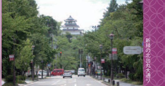
新緑の北出丸大通り