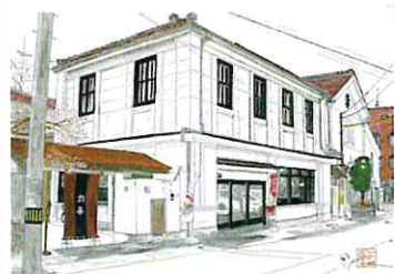
大町三之町 会津塗伝承館 鈴善漆器店

お問い合わせ先: 090-2988-2229 (会津若松まちなか散策ガイドの会: 大塚)