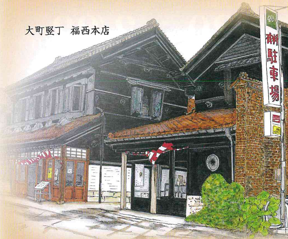
大町堅丁 福西本店