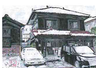
大町堅丁 会津壺番館 (野口英世青春館)