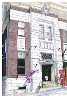
大町四つ角 カフェ&画廊 大正館