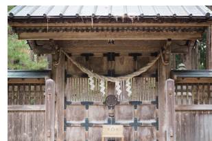
土津神社 保科正之公が眠る墓所 (奥の院)

*洞門くぐりを行いますので『長靴または汚れても良い靴・懐中電灯』をご持参ください！