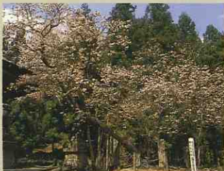
虎の尾桜 [たらのおざくら] 開花時期 4月下旬 ●会津美里町雀林・法用寺 三重の塔で知られた法用寺観音堂前。その形を虎の尾にたとえ、花から細い葉がでてくるからそう呼ばれるようになったという説がある。 お問い合わせ/会津美里町観光協会 TEL0242-56-4882