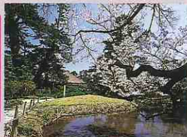
おやくえん 御薬園の桜 開花時期 4月下旬 見事な庭園をもつ歴代会津藩主の別荘であった。約400種もの薬草をもつ薬草園もある。 お問い合わせ 御薬園 TEL0242-27-2472