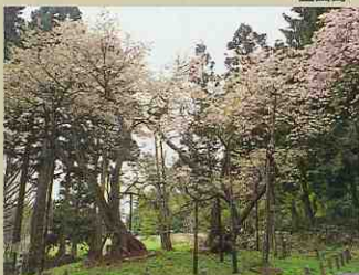
大鹿桜 [おおしかざくら] 開花時期 5月上旬 ●猪苗代町西峯磐梯神社(いわはしじんじや)社伝によると、天曆年間(九四七~九五七)に村上天皇の勅使が磐梯神社の参拝の折に京都から移植したものと伝えられる。葉と花が同時に開き、ソメイヨシノより濃い色味の花が咲く。 お問い合わせ/猪苗代町観光協会 TEL0242-62-2048