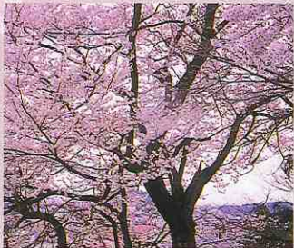
たゆう 太夫桜 開花時期 4月下旬 飯盛山の急斜面に立ちあがり、圧倒される美しさとなる。