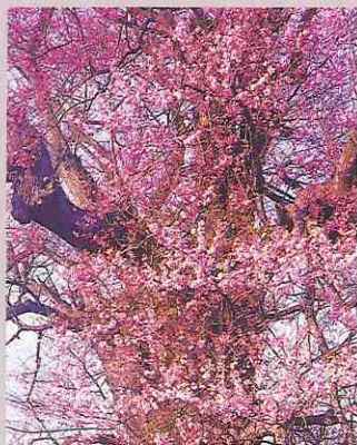
たねま 種蒔き桜 開花時期 4月下旬 稲の種蒔きの頃満開となることから「種蒔き桜」という。