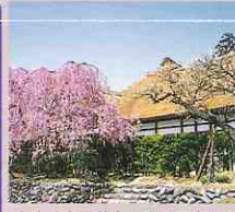
会津武家屋敷 「幕末明治に生きた会津の女性展」 会津武家屋敷内に咲く見事な桜。なお、御衣黄(ぎょいこう)・右近(うこん)の桜もあわせてご覧下さい。