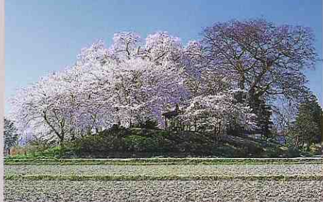
こうざしじょうあと 神指城跡の桜 開花時期 4月下旬 上杉景勝の築城跡。約20本のソメイヨシノが並び、また、同地に国の天然記念物「高瀬の大ケヤキ」もある。