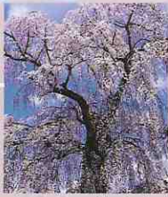
建福寺の枝垂れ桜 開花時期 4月下旬 下垂した枝に薄紅色の花が咲き、優しさにあふれた桜である。