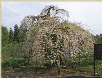
杉の糸桜 [すぎのいとざくら] 開花時期 4月下旬 ●会津坂下町杉地区薬王寺 白色の花が流れ落ちるようにも見えるエドヒガン系のシダレザクラである。杉地区の薬王寺境内にあり、両側の木はこの糸桜の子孫である。 お問い合わせ/会津坂下町観光協会 TEL0242-83-2111