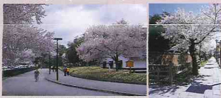
県立博物館東側の桜 北出丸大通り桜並木